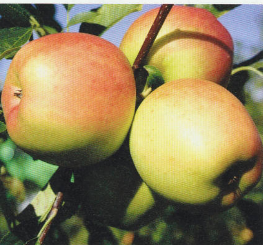
Schorfresistente Apfelsorte 'Opal' (Prüfstufe 1)