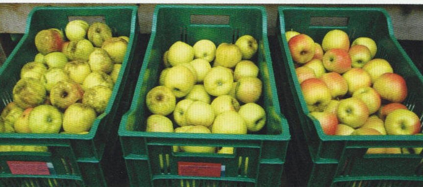
Unterschiedliche Qualitätsstufen bei 'Opal' im Öko-Quartier nach dem regen- und pilzinfektionsreichen Jahr 2009: links Ausschuss, überwiegend durch Rußfleckenbefall bedingt

In die Prüfstufe 2 (Öko-Quartier) kommt nur ein kleiner Teil der Nummern oder Sorten. So wurden im Dezember 2005 je 32 Bäume der Sorten 'Orion', 'Sirius' und 'Luna' und 96 Bäume von 'Opal' gepflanzt, jeweils auf Unterlage M 9 mit einem Pflanzabstand von 3,5 m × 1,2 m. Alle vier Sorten sind gelbschalig, stammen aus dem Züchtungsprogramm von Prof. Tupy in Prag und entstanden aus Kreuzungen der Elternsorten 'Topaz' und 'Golden Delicious'.