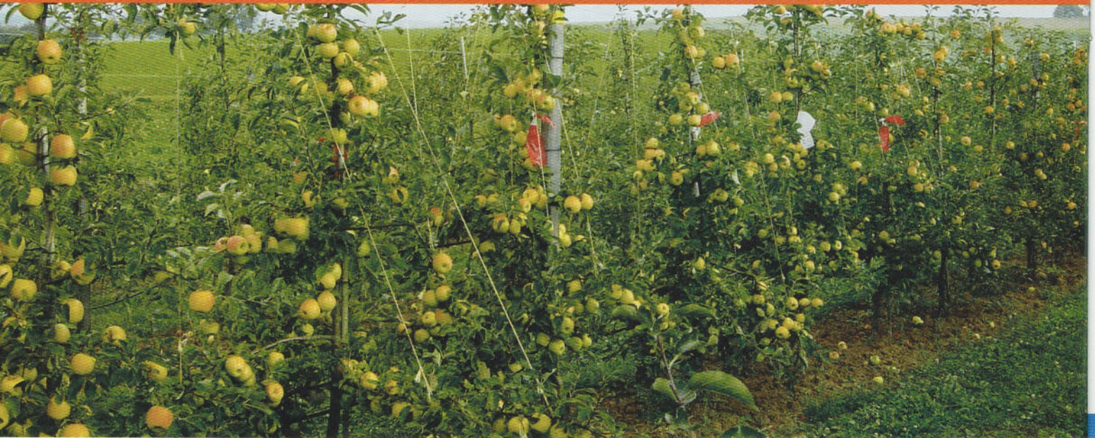
'Opal' kurz vor der Ernte 2009, ohne Handausdünnung