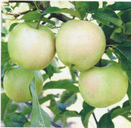
Schorfresistente Apfelsorte 'Luna' (Prüfstufe 1)